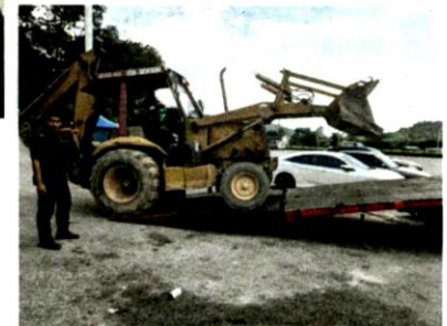
ANTARA jentera yang dirampas dalam gerakan.