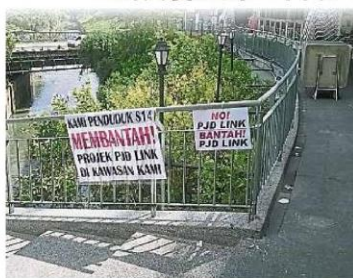
灵市居民曾在2016年反对八打灵再也疏散大道计划。(档案照)