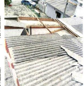
↑一民宅屋顶被吹飞。