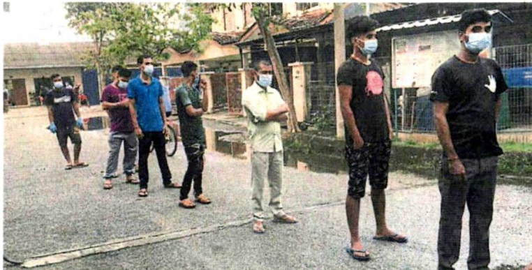
取积极管控措施。 ■外籍工出现确诊病例后,立刻采取 顶级手套厂在冠病检测中发现