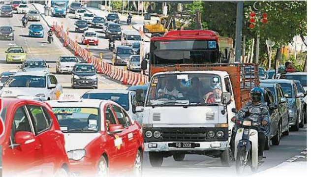
灵市居民认为，灵市的交通已经非常拥堵，无须再增设大道来加剧塞车问题。(档案照)