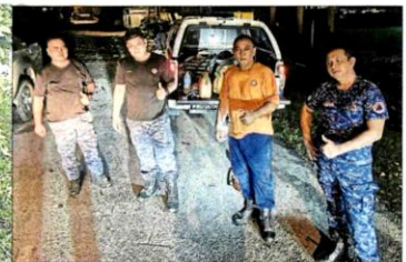
■感谢大马民防部队不惧被大蚂蚁咬的痛楚，完成善后工作。（取自面子书）