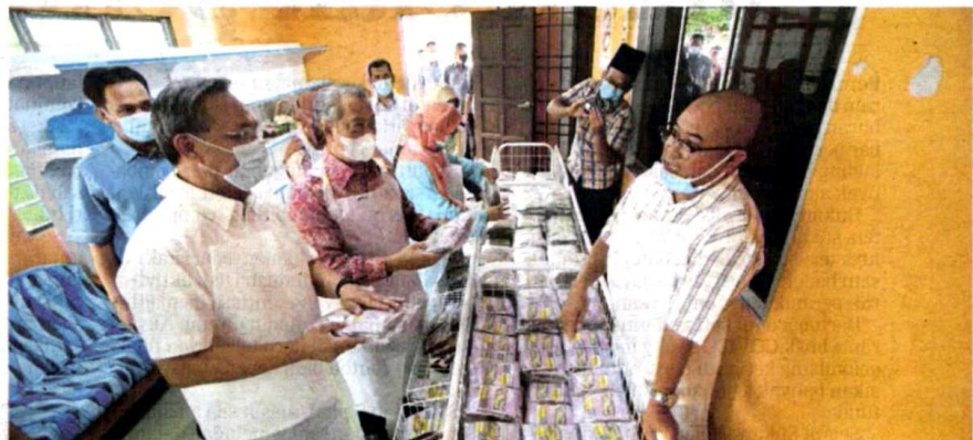
Muhyiddin terus mendapat sokongan pelbagai kaum untuk menerajui pentadbiran Putrajaya.

Yang turut tersenarai dalam tinjauan itu adalah bekas Menteri Besar Kedah, Datuk Seri Mukhriz Mahathir yang memperoleh sokongan tiga peratus; Menteri Kanan (Ekonomi), Datuk Seri Mohamed Azmin Ali (2 peratus) serta bekas Ketua Menteri Sabah,