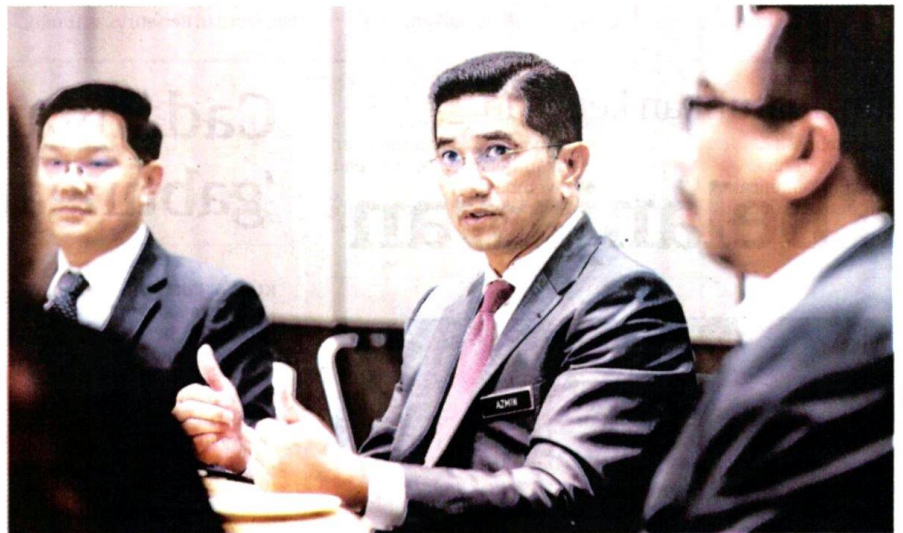
MOHAMED Azmin Ali dalam ucapan pembukaan Pengerusi Mesyuarat Menteri-menteri APEC (AMM) secara maya di Kuala Lumpur malam tadi.

"Ia satu penghormatan buat Malaysia memimpin dan merealisasikan dokumen penting ini yang akan mewujudkan warga Asia Pasifik yang terbuka, dinamik dan berdaya tahan dengan berpaksikan