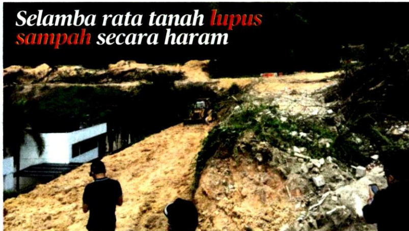
ANGGOTA penguat kuasa MPS menyebu kawasan yang dijadikan tempat pelupusan sampah secara haram.

Gombak: Tindakan individu tidak bertanggungjawab menggunakan tanah di Sungai Pusu di sini, untuk melupuskan sampah secara haram berjaya dikesan Majlis Perbandaran Selayang (MPS).