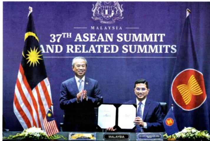
MUHYIDDIN Yassin dan Menteri Perdagangan Antarabangsa dan Industri, Datuk Seri Mohamed Azman Ali selepas majlis menandatangani Perjanjian Perkongsian Ekonomi Komprehensif Serantau secara maya di Kuala Lumpur. Ahad lalu.

RCEP merangkumi 10 ekonomi Asia Tenggara bersama China, Jepun, Korea Selatan, New Zea-