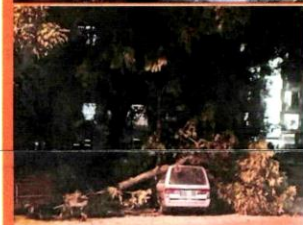
■大树压倒在轿车上。